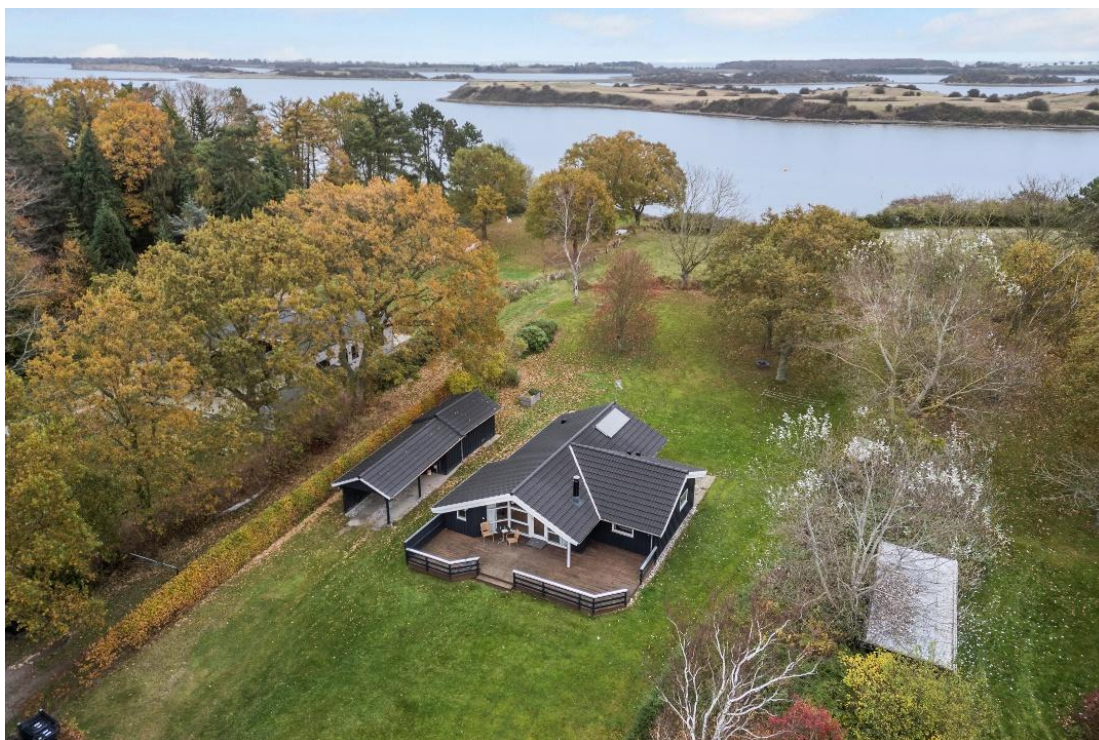
Foreningens nye feriebolig på den fynske halvø Langø ligger naturskønt med vand til to sider.

Administrationen af foreningens ferieboliger er et kerneområde for Forhandlingsudvalget. Også på det område har 2025 været et travlt år. Efter mange sonderinger og konkret søgen efter et attraktivt beliggende sommerhus, blev et nyere hus på Langø-halvøen i Kerteminde Kommune købt i sommeren 2025. Udlejningen