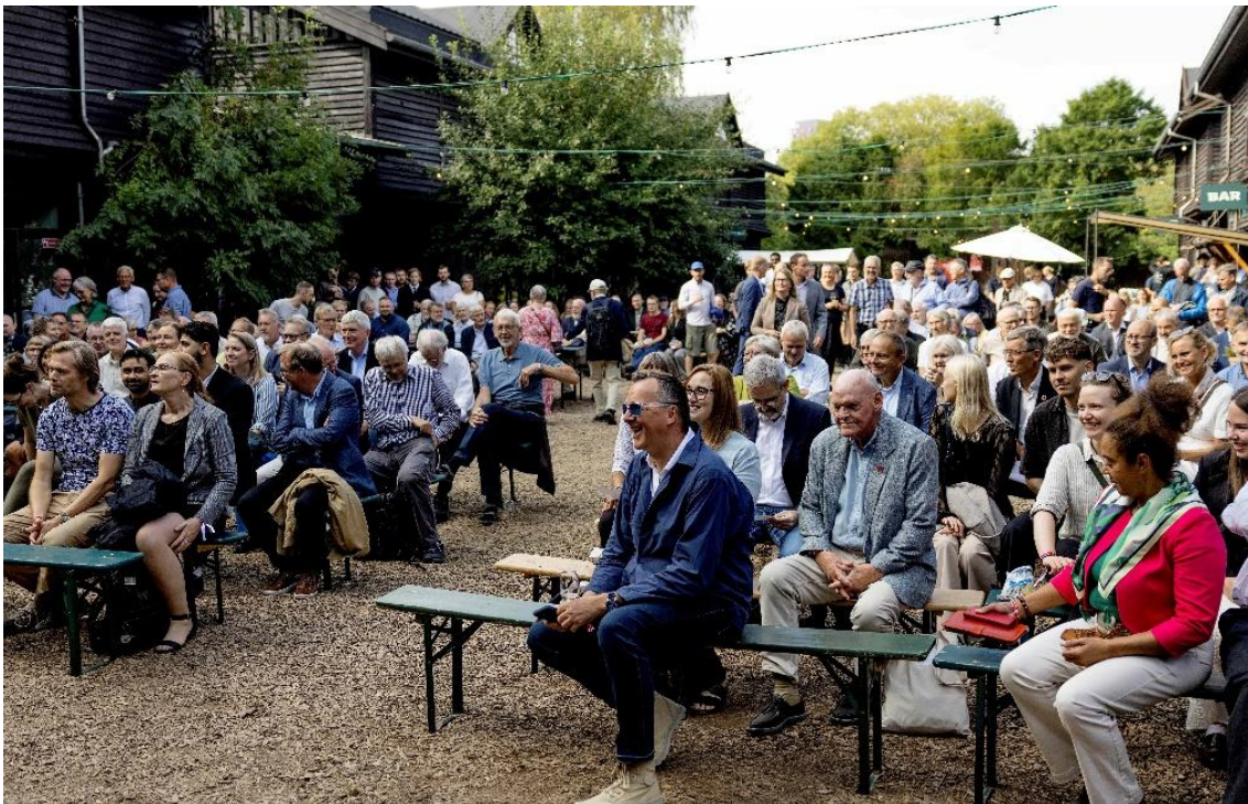
Jubilæumsfesten den 30. august 2025 var et tilløbsstykke – selv solen havde fundet vej til BaneGarden.

2025 blev et særligt år i Landinspektørforeningens historie. Året markerede 150-året for foreningens stiftelse – en milepæl, som både gav anledning til at se tilbage på professionens og foreningens lange udvikling og til ikke mindst at skærpe blikket fremad. Bestyrelse, udvalg og sekretariat har arbejdet målrettet med at omsætte medlemsinput og strategi til konkret handling. Her er et overblik over foreningens væsentligste aktiviteter og resultater i 2025.